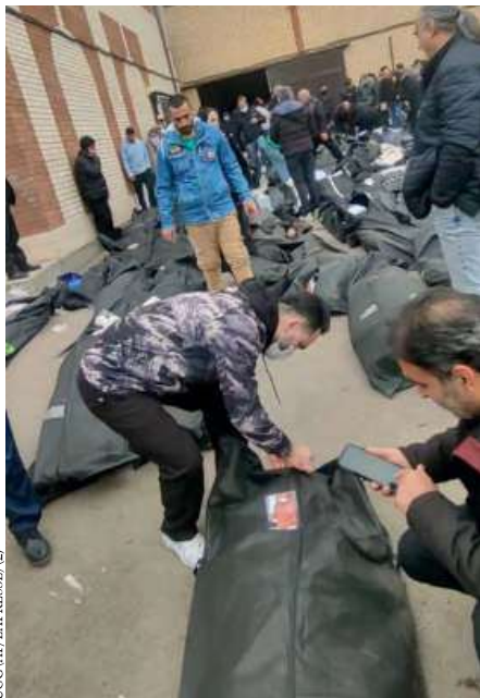
UCC (2)