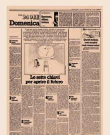
4 dicembre 1983. La copertina del primo inserto «Domenica», che all'epoca era all'interno del giornale