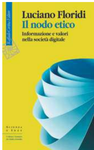
Luciano Floridi "Il nodo etico" Raffaello Cortina Editore pp. 416, € 25

Luciano Floridi, una delle voci più autorevoli della filosofia contemporanea, è direttore del Digital Ethics Center e professore nel programma di Scienze cognitive all'Università di Yale. Dal 2021 è professore presso il dipartimento di Scienze giuridiche dell'Università di Bologna. Tra i vari premi e riconoscimenti, nel 2022 è stato nominato Cavaliere di Gran Croce OMRI dal presidente Mattarella per il suo lavoro fondamentale in filosofia. Per Raffaello Cortina ha pubblicato "La quarta rivoluzione" (2017), "Pensare l'infosfera" (2020), "Il verde e il blu" (2020), "Etica dell'intelligenza artificiale" (2022) e "Filosofia dell'informazione" (2024)