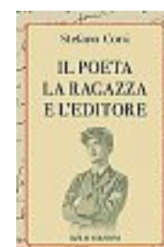
STEFANO CORSI Il poeta, la ragazza e l'editore BOLIS Pagine 136, € 14

Corsi (Bergamo, 1964) è autore per Bolis, tra l'altro, di Una piccola patria (2016) e di Meno male c'è sempre qualcuno che canta (2025)