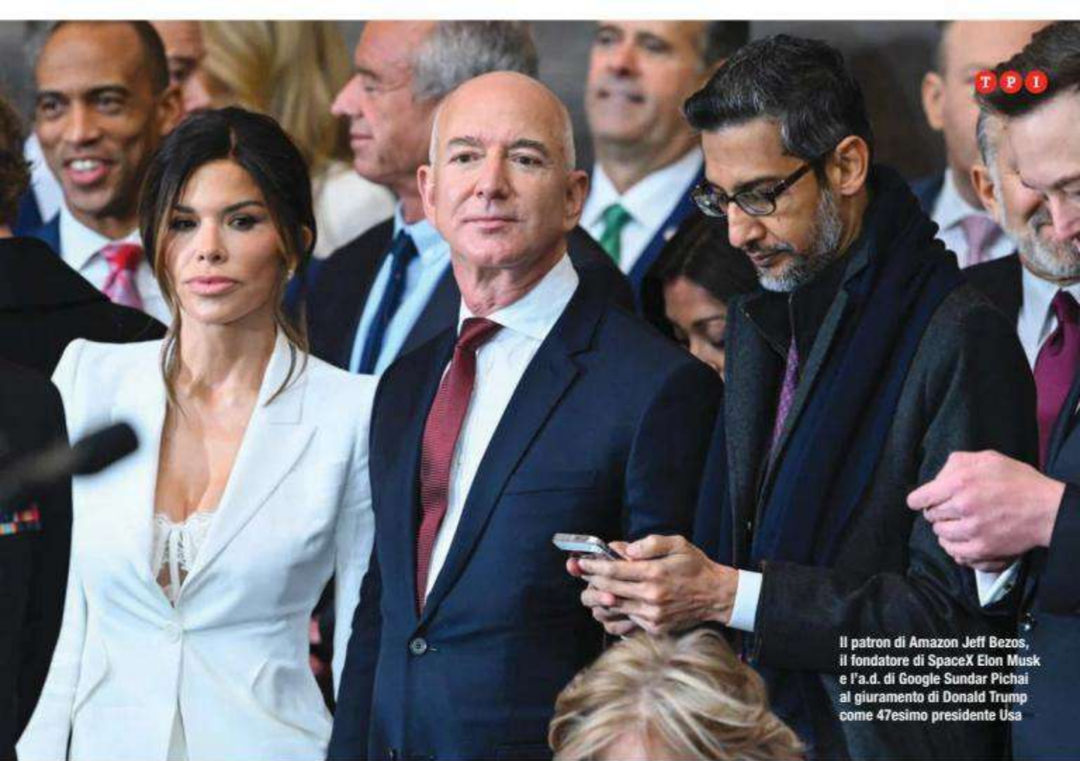
Il patron di Amazon Jeff Bezos, il fondatore di SpaceX Elon Musk e l'a.d. di Google Sundar Pichai al giuramento di Donald Trump come 47esimo presidente Usa

nazionale. Nei primi anni Venti, il governo fascista prese il potere in Italia. Uno dei suoi primi atti fu incarcerare Gramsci. Le ragioni furono esplicitate dal pubblico ministero durante il processo: bisognava mettere a tacere quella voce. Questo ci riporta all'importanza dei media indipendenti: "Dobbiamo mettere a tacere questa voce". E così fu mandato in carcere. In prigione scrisse i "Quaderni del carcere". Non fu messo a tacere, anche se nessuno poteva leggerlo. Continuò il lavoro che aveva iniziato e sviluppò il suo pensiero, comprese alcune delle riflessioni che hai citato. All'inizio degli anni Trenta scrisse che il vecchio mondo stava crollando, ma che il nuovo non era ancora emerso, e che in questo vuoto proliferavano i sintomi morbosi. Mussolini era uno di questi sintomi. Hitler un altro. La Germania nazista arrivò a conquistare gran parte dell'Europa e quasi dominò il mondo. Ci andammo molto vicino. Furono i sovietici a sconfiggere Hitler. Altrimenti, probabilmente metà del pianeta sarebbe stata governata dalla Germania nazista. I sintomi morbosi