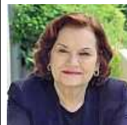
L'autrice Storica e psicoanalista, Élisabeth Roudinesco (Parigi, 1944) è direttrice di ricerca all'Université Paris VII e fondatrice dell'Institut Histoire et Lumières de la Pensée. Tra i suoi libri: Sigmund Freud nel suo tempo e nel nostro (Einaudi, 2015)